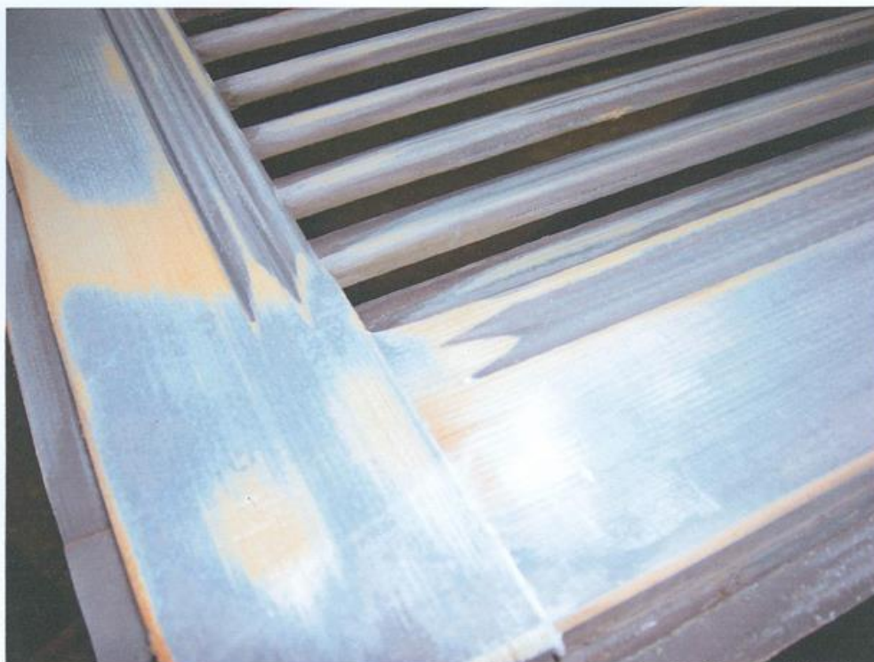
Foto 1. Prova di pulitura su angolo di anta a battente necessaria alla ricerca del colore originale.