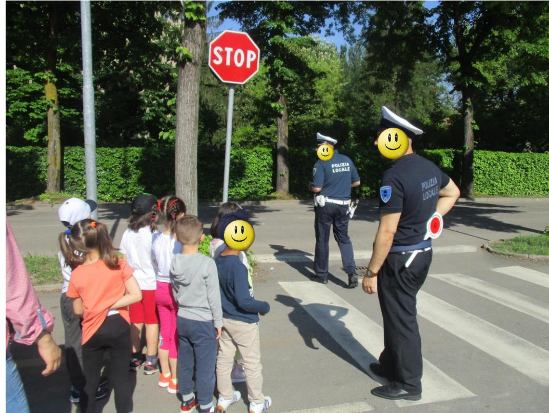
Consapevolezza del futuro cittadino e sicurezza sulla strada