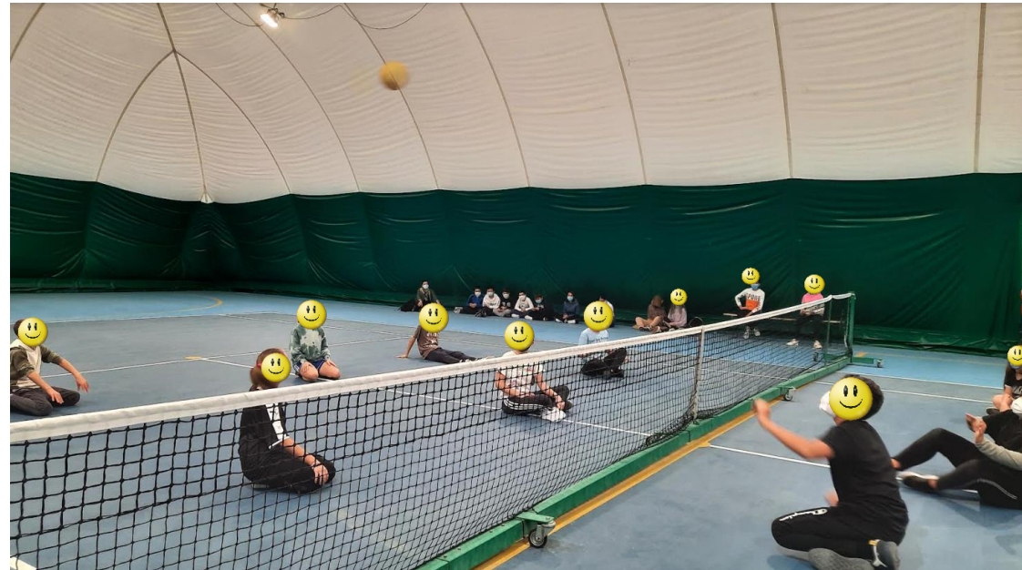
Momenti di sport senza barriere